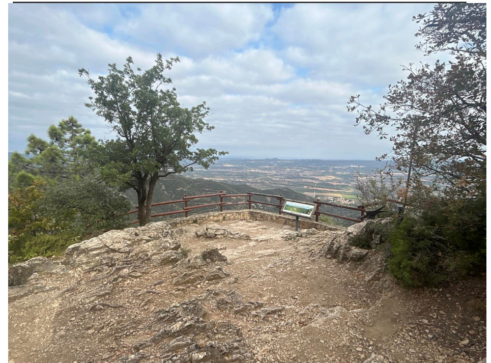
Mirador de la Pena